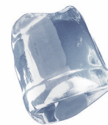
18 gr FULL ICE CUBE